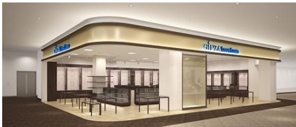
GINZA LoveLove イオンモール東浦店 エントランスイメージ

株式会社セキド（本社・東京都渋谷区、社長・関戸正実）は、愛知県・イオンモール東浦店の増床棟にて、ブランドショップ「GINZA LoveLove イオンモール東浦店」を4月19日（金）にグランドオープンいたします。