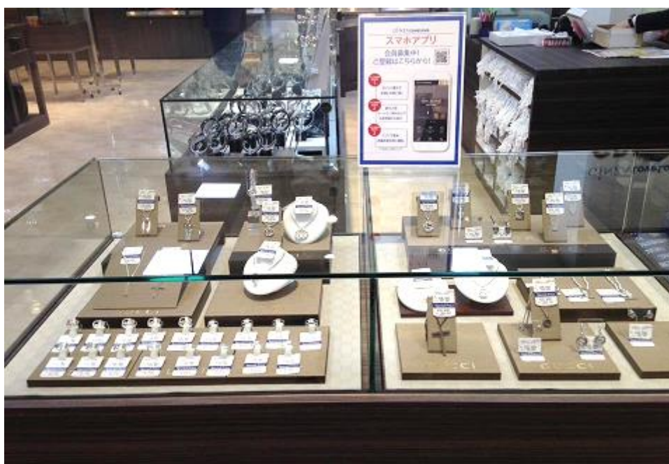
人気のブランドジュエリー