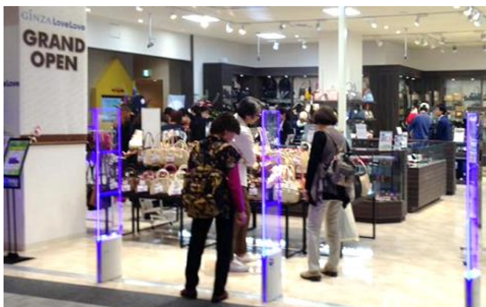
プレオープン時の様子

当初の想定を大いに超える反響のため、商品をさらに追加し、グランドオープンにいらっしゃるお客様にご案内いたします。