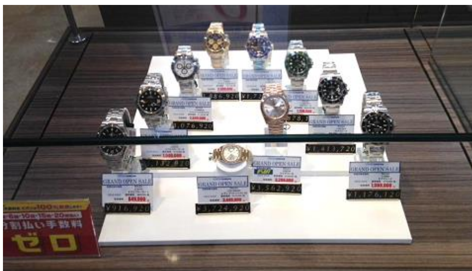
定番のブランド時計