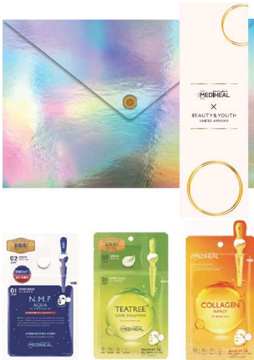
(オーロラポーチセット)